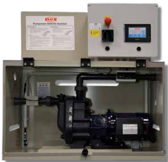
Stationäre Ausführung mit Sonderzubehör

Versiegelte Behälter lassen sich nicht mit klassischen Fass- oder Behälterpumpen entleeren , da es keine Öffnungen zum Einbringen einer Fasspumpe mehr gibt. Durch das Tauchrohr müssen die Behälter dagegen im Saugverfahren mit selbstansaugenden Pumpen entleert werden. Hierzu hat FLUX das Pumpenset SAFETEC entwickelt. Das Pumpenset enthält alle notwendigen Komponenten, die für die sichere Entleerung des Behälters erforderlich sind.